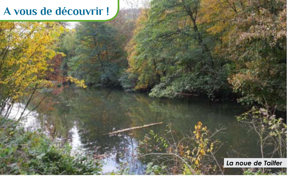
La noue de Tailfer