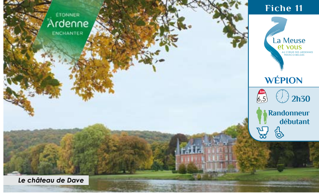
Le château de Dave

Les hivers particulièrement rigoureux dans les pays du nord obligent nombre d'oiseaux à se replier sous nos températures clémentes. Cette migration dans l'axe nord-sud nous permet d'observer des oiseaux peu courants dans nos contrées comme le jaseur boréal. Les oies cendrées migrent par milliers et peuvent s'arrêter un jour dans une noue de la Meuse avant de continuer leur périple un peu plus loin vers le sud.