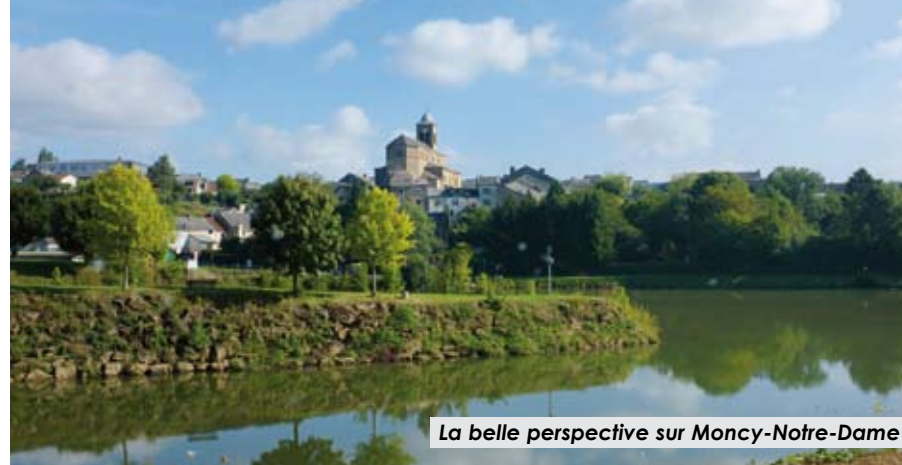
La belle perspective sur Moncy-Notre-Dame