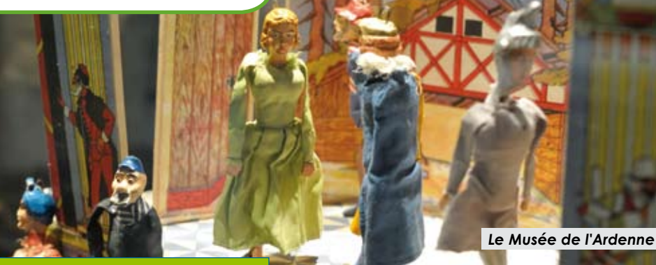
Le Musée de l'Ardenne