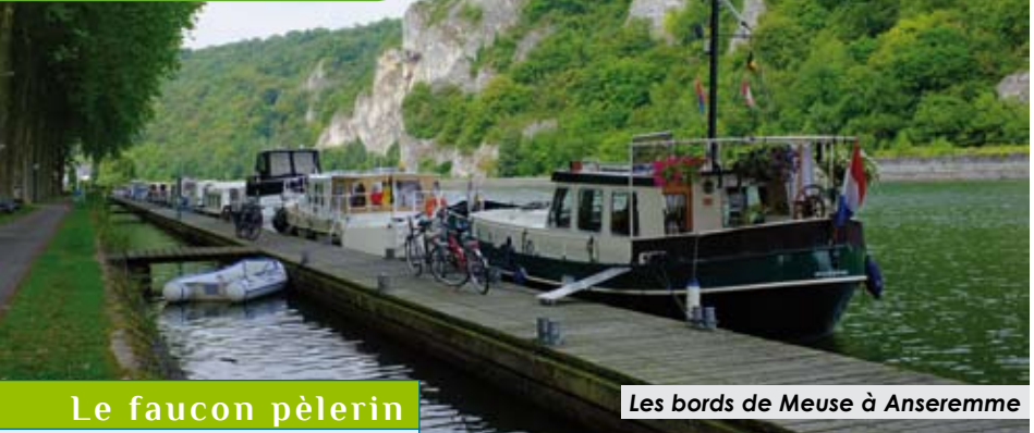
Les bords de Meuse à Anseremme